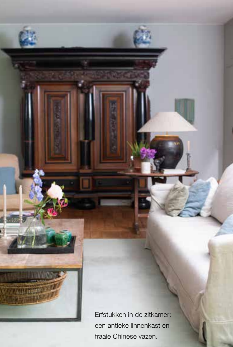
Erfstukken in de zitkamer: een antieke linnenkast en fraaie Chinese vazen.