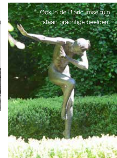
Ook in de Blaricumse tuin staan prachtige beelden.