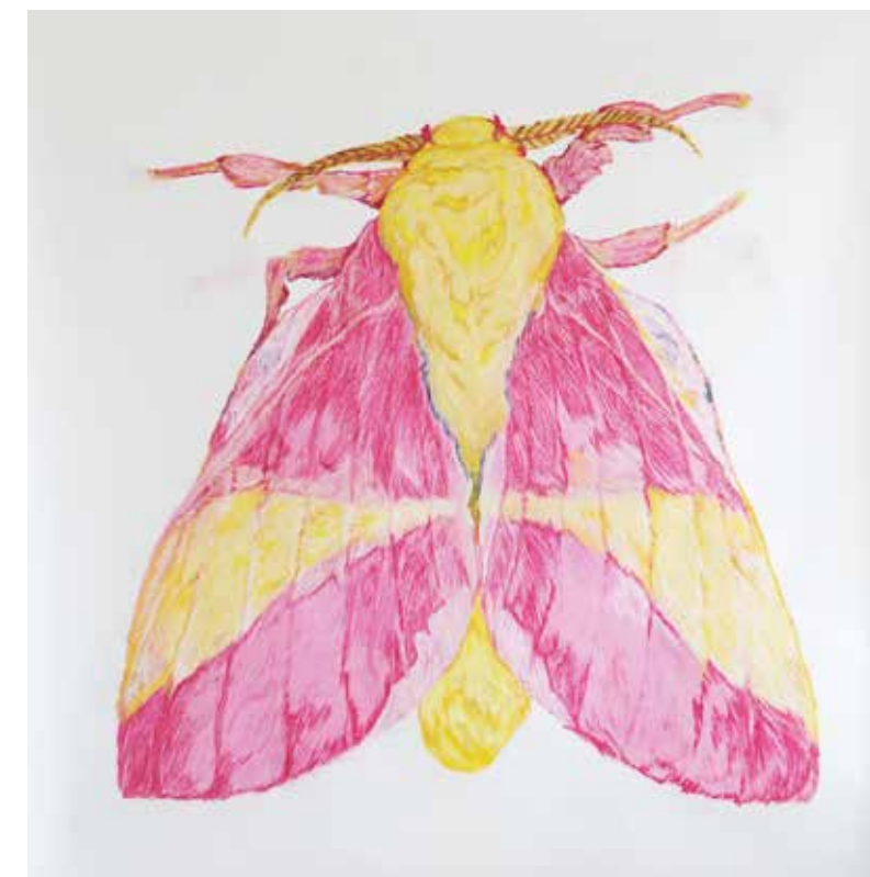
Vanaf linksboven met de klok mee: 'Pimpelmees', 2015, pastelkrijt op papier, 200 x 130 cm. 'Bird of Paradise', 2016, pastelkrijt op papier, 215 x 120 cm. 'Rosy Maple Moth', 2015, pastelkrijt op papier, 200 x 150 cm. 'Bluebird of Paradise', 2016, pastelkrijt op papier, 245 x 150 cm.