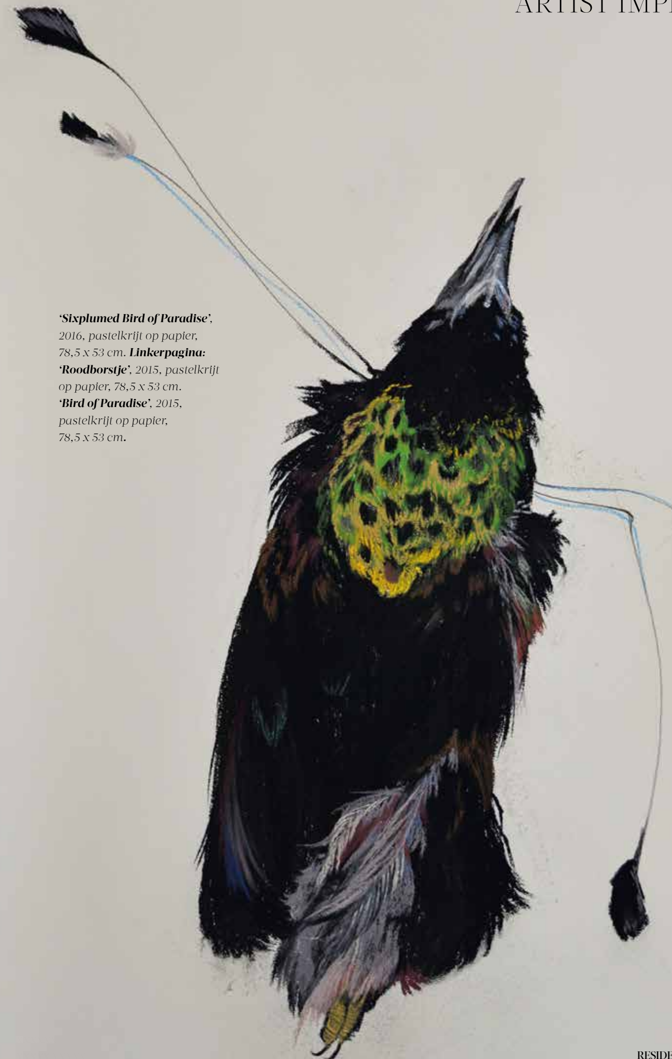
'Sixplumed Bird of Paradise', 2016, pastelkrijt op papier, 78,5 x 53 cm. Linkerpagina: 'Roodborstje', 2015, pastelkrijt op papier, 78,5 x 53 cm. 'Bird of Paradise', 2015, pastelkrijt op papier, 78,5 x 53 cm.